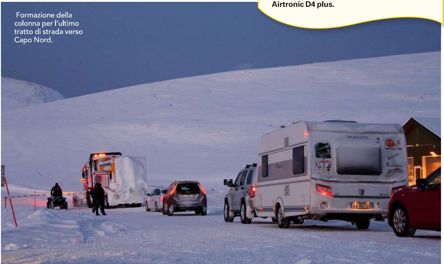
Formazione della colonna per l'ultimo tratto di strada verso Capo Nord.

La roulotte durante il viaggio all'interno viene mantenuta ad una temperatura costante di 18° sia per evitare eventuali congelamenti e rotture degli impianti ad acqua , sia per avere un comfort gradevole nei momenti di sosta. A tale scopo è stato installato, ad integrazione del riscaldamento a gas di serie, un riscaldatore supplementare a gasolio Eberspächer Airtronic D4 plus .