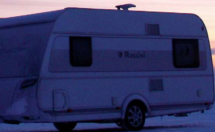
foto. La luce durerà poco e cerchiamo di scattare più foto possibili in fretta. Un vento gelato sferza le nostre mani e le nostre facce ad una velocità intorno ai 50 km/h; con queste temperature è veramente difficoltoso fare qualunque cosa. Quasi ci dimentichiamo di vedere la famosa palla di Capo Nord. Lo spettacolo, una volta attraversato l'edificio centrale, è da mozzare il fiato: i colori di questa specie di tramonto polare (sono le 13.00) sono incantevoli, veniamo colti dalla frenesia di fermarci ad immortalare quello che vediamo per cercare di rendere indelebili le nostre emozioni.

Visto il peggiorare delle condizioni del manto stradale e, soprattutto, non avendo nessuna certezza su come saranno le strade norvegesi, a Kolarin decidiamo per il cambio delle nostre gomme appoggiandoci all' officina Kolarin Kumi Oy . Qui montiamo gomme chiodate su macchina e roulotte e lasciamo in deposito le nostre gomme termiche: tutta un'altra guida, maggiore tenuta di strada significa poter guidare più rilassati.